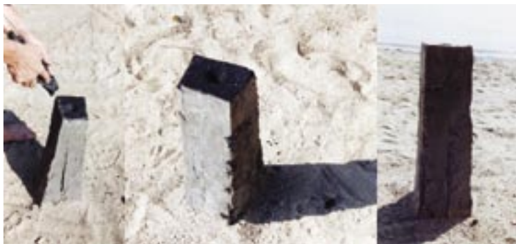
Hiidenkirnuluonnos, 2002. Kuivatettu savi ja hiili

Materiaalin tuntemuksen sekä sen tuoman helppouden kautta meille syntyy mahdollisuus kohdata tuo itsessämme oleva tuntematon, vahingossa. Kun taiteilija kokee materiaalin olevan hänelle itseilmaisun välineenä, hän löytää itsensä, minä olen muodon, vaivattomasti. Hän pystyy myös siirtämään tuon materiaalin yhteisöön me olemme hahmottamisen välineeksi.