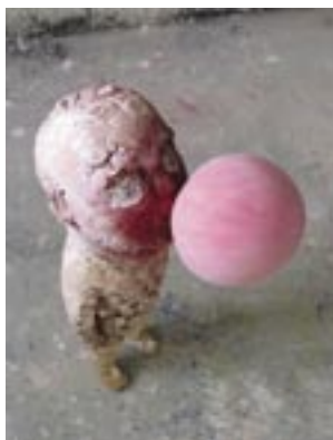
”Purkkapallo poika” sekatekniikka, Tommi Toija, 2005