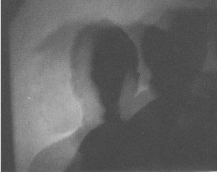
”Minä olen” omakuva, 1998. Camera obscura