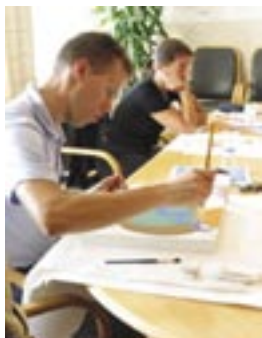
"Kaksi pintaa", 2002, henkilökohtainen toteutus.

Taiteilija on raottamassa ovea itseen ja pystyy näin synnyttämään yhteisössä itseymmärryksen välineitä.