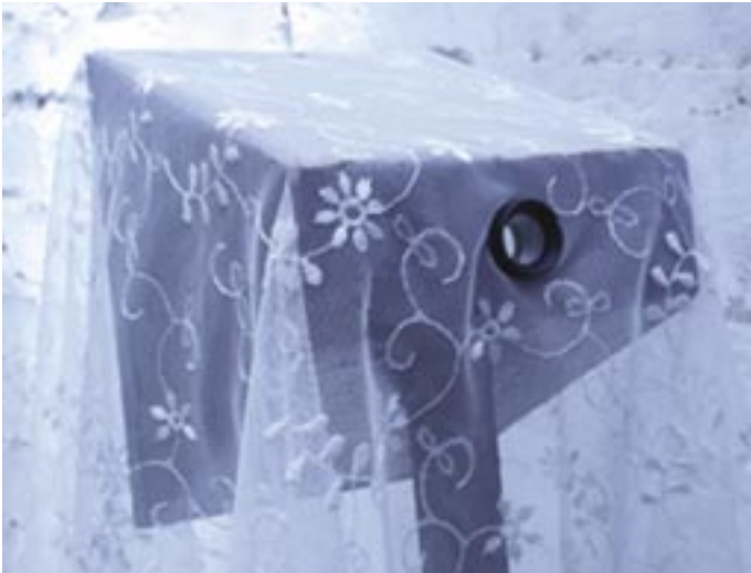
Tule kanssani...tule, tule, 2005, sekatekniikka, yksityiskohta.

” Näyttäisi siis siltä, että epäonnistuessaankin yhteisö on eräänlaista kirjoitusta, joista on vain löydettävä viimeiset sanat: ”Tule, tule, tulkaa, te tai sinä, jolla ei tuntuisi sopivan määräys,rukous tai odotus” ( Blanchot, 2004, 30.)